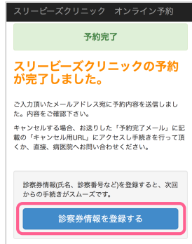
オンライン予約の予約完了画面